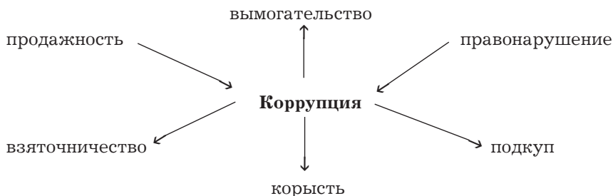
Схема - кластер

Учитель предлагает ознакомиться с некоторыми определениями понятия «коррупция» (от лат. corruptio — подкуп, порча, упадок), которые приводятся в различных справочных изданиях и документах.